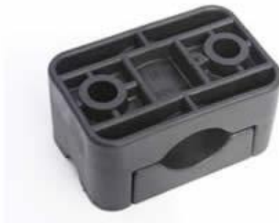
ТРОЙНА (примерен образец)